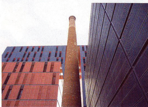
L'antiga fàbrica Ca l'Aranyó és ara el Campus de la Comunicació de la UPF.

Ara ben bé podríem dir que el Poblenou s'identifica més aviat amb la idea d'un Soho barceloní, producte d'una història plural en què les estratègies de promoció juguen un paper fonamental en la continua reinvençió de l'espai i la seva transformació en un autèntic parc temàtic cultural. Us proposem una passejada de tarda per descobrir-ho.