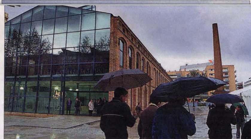
La antigua fábrica de Can Jaumandreu, en la Rambla de Poblenou, sede de la Universitat Oberta de Catalunya.