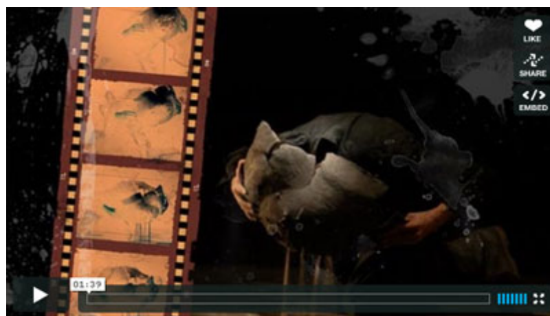
Enllaç vídeo-promo realitzat per: Jordi Cabestany